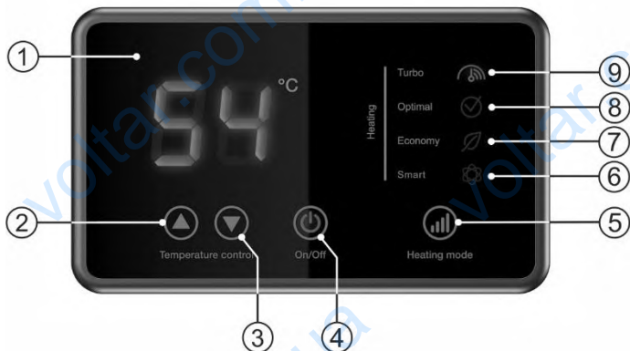
Малюнок 2. Електронна панель управління

1 - LCD дисплей, 2 - кнопка "▲" Temperature control / збільшення температури нагріву, 3 - кнопка "▼" Temperature control / зменшення температури нагріву, 4 - кнопка "On/Off" / вкл./викл, 5 - кнопка "Heating mode" / установка потужності нагріву - режиму роботи, 6 - індикація розумного режиму «Smart», 7 - індикація "Economy" / Мінімальна потужність, 8 - індикація "Optimal" / стандартна потужність, 9 - індикація "Turbo" / максимальна потужність.