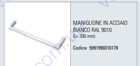
MANIGLIONE IN ACCIAIO BIANCO RAL 9010 (L= 390 mm)

Per l'elenco completo consultare pag. 60