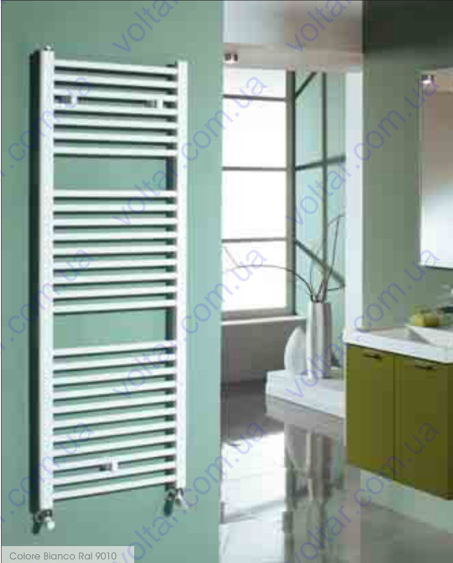
Colore Bianco Ral 9010

Il radiatore d'arredo adatto a tutti gli ambienti bagno. Semplice e funzionale, LISA 2 è ideale per creare calore e arredare con un tocco di classe. Particolarmente indicato per condomini e grandi utenze.