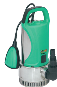
SX 600 D HL

P1 350 watt Q max. 140 l/min H max. 6,9 m