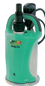
SX 350/S HL

P1 350 watt Q max. 140 l/min H max. 6,9 m